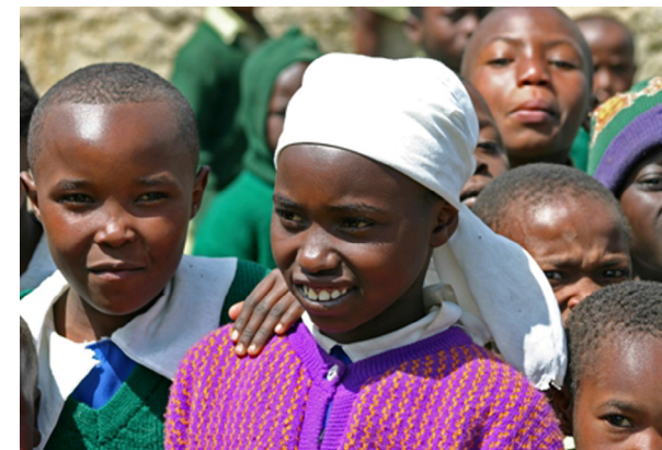
Børn fra Githabai Primary School, Kenya.

Læs om, hvordan du kan støtte børnene på Githabai