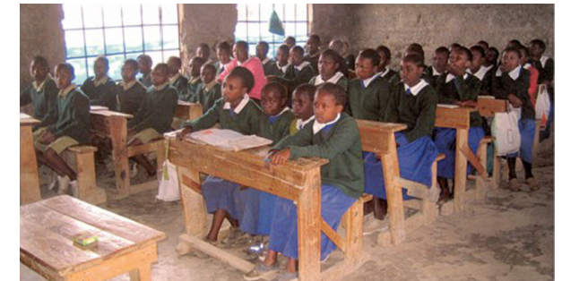
Githabai Primary School, Kenya.

Med venlig hilsen og tak for hjælpen Githabais Venner